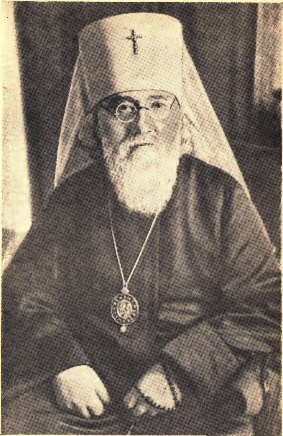
Митрополит Киевский и Галицкий Иоанн, Экзарх Украины